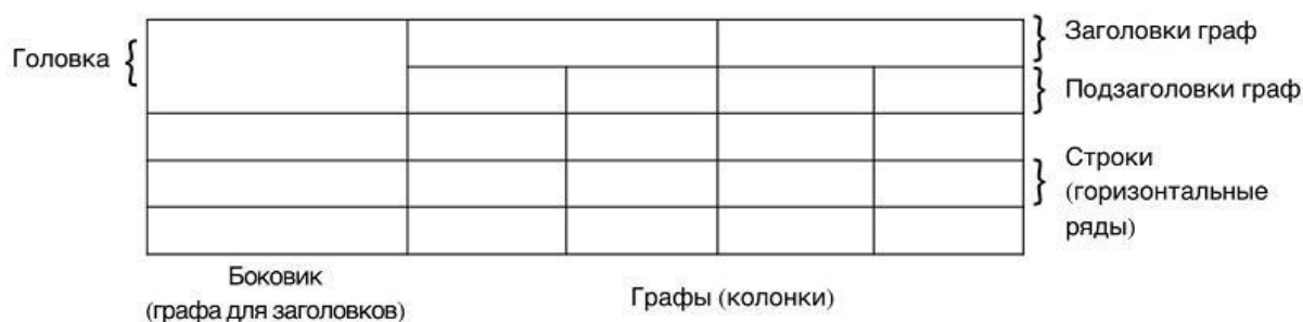
Рис. 3. Оформление таблиц

В каждой таблице следует указывать единицы измерения показателей и период времени, к которому относятся данные. Если единица измерения в таблице является общей для всех числовых данных, то ее приводят в заголовке таблицы после ее названия.