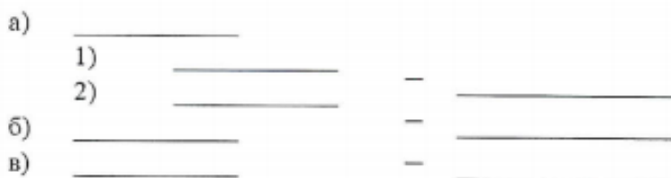
Рисунок 4 – Примеры оформления списков

Для дальнейшей детализации перечислений необходимо использовать арабские цифры, после которых ставится скобка, а запись производится с абзацного отступа, как показано в примере (рис. 5):