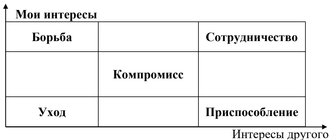
Рис. 2. Стратегии поведения в конфликте

– Мини-лекция «Стратегии поведения в конфликте». Ведущий предлагает для анализа рисунок, раскрывающий стратегии поведения: уход, приспособление, компромисс, борьба и сотрудничество, раскрывает преимущества и недостатки каждой стратегии. Важно подчеркнуть, что стратегия сотрудничества нуждается в постоянном развитии. Все остальные стратегии, как правило, приходят из детства и включаются почти автоматически в релевантных ситуациях.