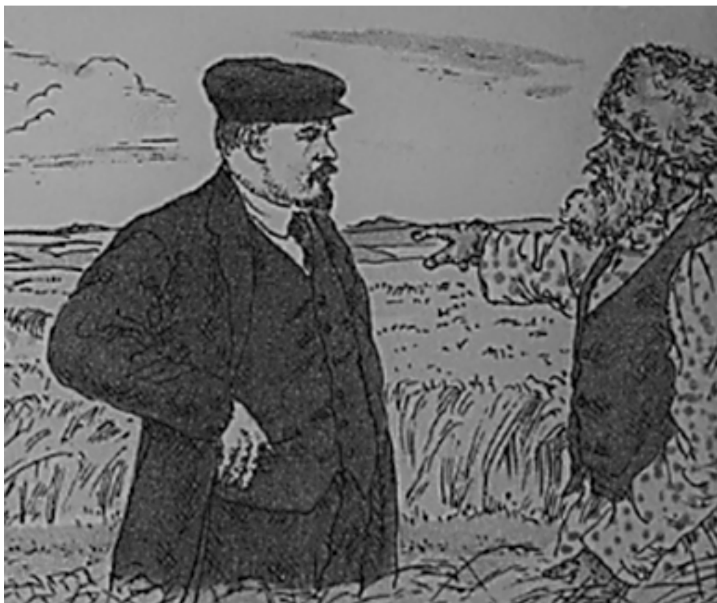
Рис. 2. Б. М. Кустодиев. Иллюстрация из книги «Детям о Ленине»

Каждый визуальный эпизод наполнен множеством деталей, останавливающих взгляд и неспешно рассматривающих композицию.