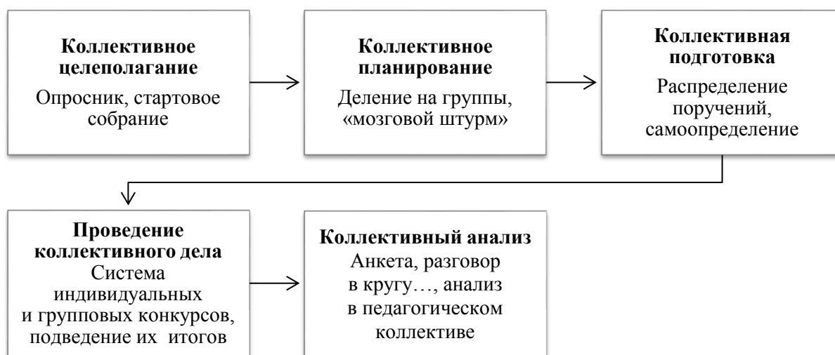
Рис. 1. Технологическая цепочка КТД по И. П. Иванову

Технологическая цепочка КТД по И. П. Иванову представляет собой последовательность нескольких этапов (рис. 1):