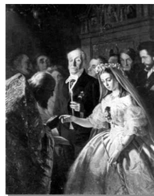
В.В. Пукирев «Неравный брак»

Попы! Стригите свой приход! Разделим братски наш доход! Крестьян – под феодальный кнут! Свинье-народу – рабский труд, А дочерям его – почёт: Всем до одной, наперечёт, В день свадьбы право мы даём С сеньором лечь в постель вдвоём. Встречай владыку, голытьба! Ура, маркиз де Караба!