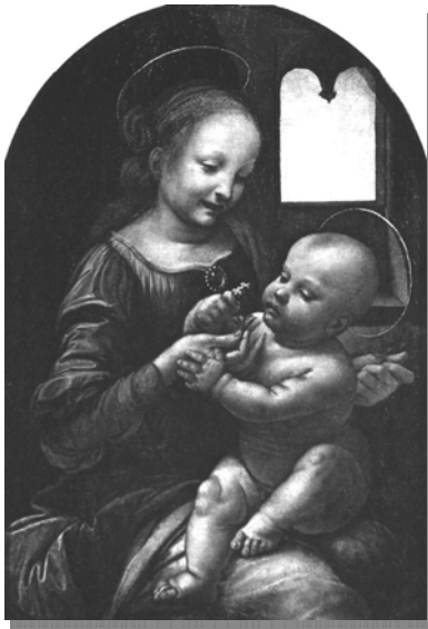
“Мадонна Бенуа” Леонардо да Винчи

Это основа брака, а все остальное – фон, который изменяется все время, как изменяется сам человек. Прожить в браке месяц, год и всю жизнь – не одно и то же. «Здесьние семьи, кажется, управляют сами собой. У мужа только тень власти над женою, у отца – над детьми, у господина над рабами» 96 , – писал Шарль Монтескье. Но он, описывая перипетии бракоразводных дел, различные претензии жен, доходящие до бесстыдства, продолжал: «Бывают и такие, что осмеливаются бросать вызовы мужьям и требуют от них публичного состязания, весьма затруднительного в присутствии посторонних: такое испытание столь же позорно для женщины, подвергающейся ему, сколь и для мужа, унизившегося до него» 97 .