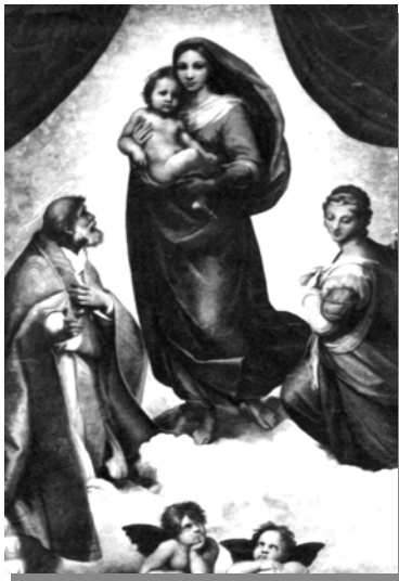
“Сикстинская мадонна” Санти Рафаэль

тание столь же позорно для женщины, подвергающейся ему, сколь и для мужа, унизившегося до него» 97 .