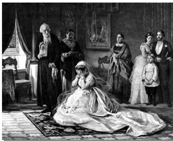
Ф.С. Журалев «Перед венцом»

Нужда, экономический интерес, безысходность и многое иное