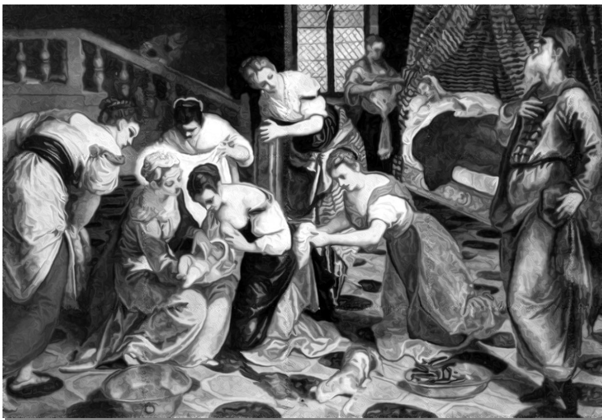
Тинторетто "Рождение Иоанна Крестителя"

Молодые люди сами должны готовить себя к будущей семейной жизни. Следует всячески раскрывать ценность брака, его сущность, его назначение. Институт семьи – один из самых древних институтов. Великие художники в своих полотнах прекрасно отразили его сущность. Среди них Рафаэль «Святое семейство», Тинторетто «Рождение Иоанна Крестителя». О семье написано очень много. Достаточно сослаться на хорошее издание, книги «Семья. Книга для чтения».