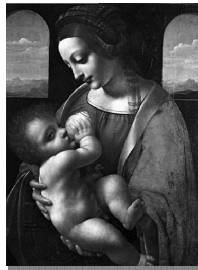
“Мадонна Литта” Леонардо да Винчи

Говоря о браке, следует иметь в виду то, что брачная пара согласовывает свои желания самого разного характера. Люди стараются находить способы, управляя этими желаниями.