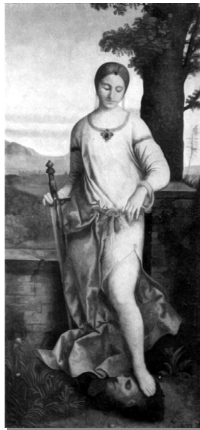
«Юдифь» Джорджоне де Кастельфранко

Это всего лишь авторский вымысел, но вымысел, отражающий реальность человеческих взаимоотношений. Женская красота – величайшая сила! Она может очаровать и действительно очаровывает миллионы мужчин. Какое счастье она может принести человеку? Прекрасна любая женщина с ребенком на руках. Неслучайно великие итальянские художники эпохи Возрождения оставили свои бесценные полотна на данный сюжет. Среди них картины Леонарда да Винчи «Мадонна Литта», «Мадонна Бенуа», Санти Рафаэля, «Сикстинская мадонна». Однако красота может принести и несчастье. Венецианский художник написал великолепную картину «Юдифь». Сюжетом картины послужила библейская легенда о подвиге молодой красивой вдовы Юдифи. Когда ассирийские войска осадили ее родной город Ветилию, она отправилась в стан врага. Покорив своей красотой предводителя ассирийцев Олоферна, Юдифь отрубила ему спящему голову. Как было уже сказано ранее, основа прочности брака – это взаимность, взаимность во всем, взаимность супругов при закрытых дверях, где достигается гармония ни от «позы и тела», а от понимания. При таком «климате брака» семья будет управляться сама собой.