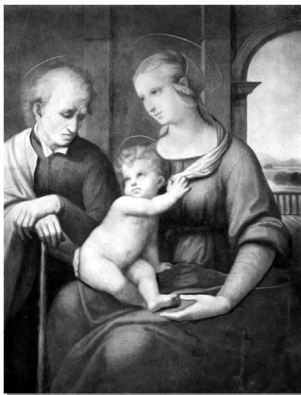
Рафаэль "Святое семейство"

оценка ценности брака. В молодые годы многие не отдают себе отчет в том, что творят, а часто просто не ведают, что творят. " Iventus ventus " – юность ветрена, гласит латинская поговорка. Физическая близость не является обязательной основой для заключения брака. Если кто-то был с кем-то в любовной связи, то от этого автоматически они не становятся мужем и женой.