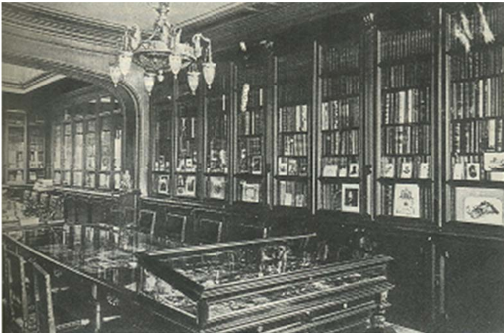
Библиотека А. А. Бахрушина.