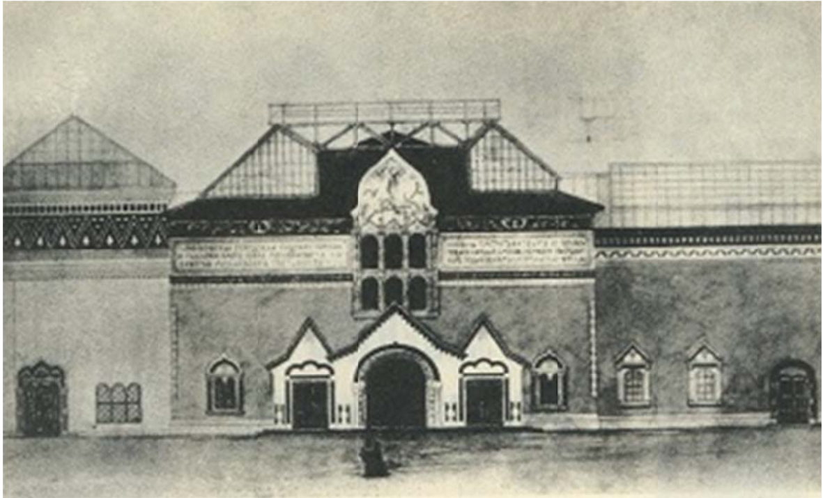
В.Н. Башкиров. Рисунок фасада Третьяковской галереи по проекту В.М. Васнецова. 1901 г.