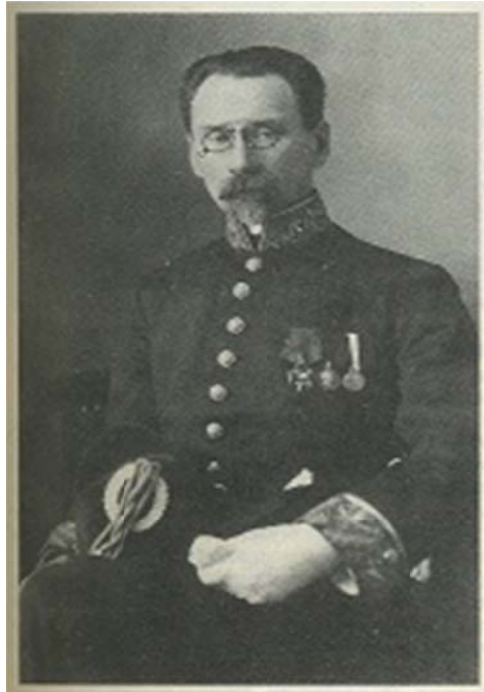
Фото Алексея Александровича Бахрушина. 1910 г. Из фондов Государственного Центрального театрального музея