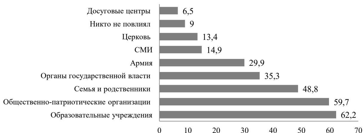
Рис 2. Институты и агенты, которые активно участвуют в патриотическом воспитании молодежи, в % (n=202)

В исследовании важным индикатором выступали институты и агенты, которые принимают активное участие в патриотическом воспитании молодого поколения. Так, большинство участников общественных организаций отметили, что активное влияние на формирование патриотических взглядов молодежи оказывают образовательные учреждения и общественно-патриотические организации. Около половины молодых людей отметили, что семья и родственники оказывают существенное влияние на патриотическое воспитание подрастающего поколения. Около трети подростков считают, что активно принимают участие в развитии патриотических взглядов молодежи органы государственной власти и армия. Меньшая часть участников общественных движений к таким институтам и агентам относит СМИ и церковь, а наименьшее количество молодежи – досуговые центры. Также на меньшую часть подростков никто не повлиял при формировании и развитии патриотических взглядов (см.рис.2).