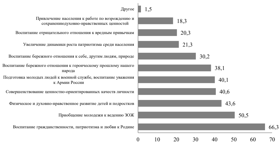
Рис 3. Значение патриотических движений для страны в оценках их участников, % (n=202)

молодых людей считают, что воспитание гражданственности, патриотизма и любви к своему Отечеству формируют и развивают у подростков общественные организации. Половина участников патриотических объединений отмечают, что данные организации приобщают подростков к ведению здорового образа жизни, занятию спортом. Меньше половины молодежи отметили, что важность патриотических движений состоит в том, что они всестороннее развивают детей и подростков, формируют у них духовно-нравственные ценности, подготавливают юношей к военной службе в Вооруженных силах России. Около трети участников считают, что молодежные организации воспитывают у подрастающего поколения бережное отношение к героическому прошлому нашего народа, к себе, окружающим людям, животным и природе. Меньше четверти молодых людей отметили пользу деятельности данных организаций в увеличении динамики роста патриотизма среди молодежи, воспитание отрицательного отношения к вредным привычкам и привлечение граждан к работе по возрождению и сохранению духовно-нравственных ценностей страны (см.рис.3).