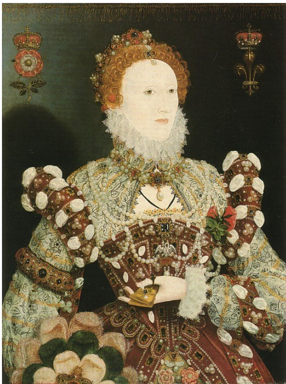
Портрет с пеликаном. Приписывается Хиллиарду. 1575 г.