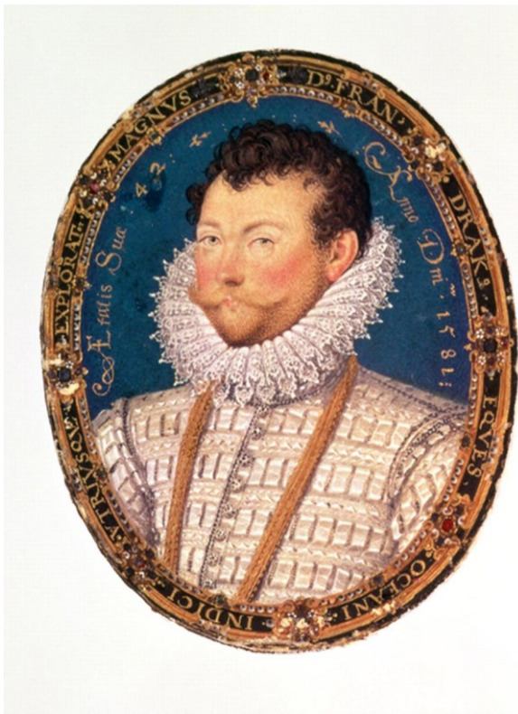
Портрет Фрэнсиса Дрейка. Работа Хиллиарда. 1581 г.

В елизаветинской Англии широкое распространение получили миниатюры. Самыми известными художниками-миниатюристами считаются Николас Хиллиард и его ученик Исаак Оливер. Хиллиард стал основателем английской школы портретной живописи. С 1570 года он работал придворным миниатюристом Елизаветы I. Помимо портретов королевы, он писал миниатюрные изображения аристократов.