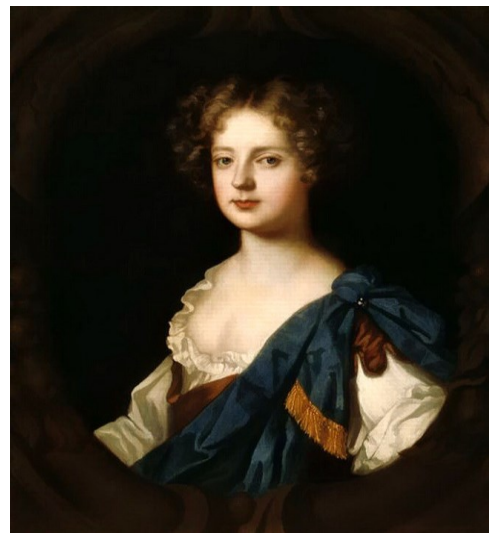
Элинора (Нелл) Гвинн