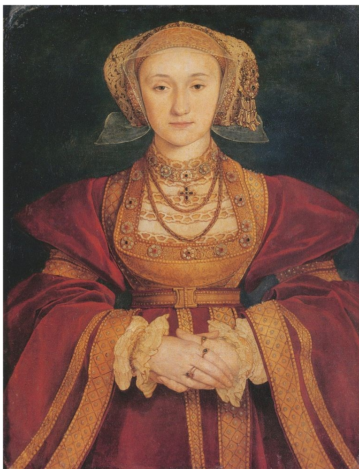
Анна Клевская. Портрет работы Ганса Гольбейна Младшего. 1539 г.

жестве. Он заказал портрет художнику Гансу Голбейну, и согласно легенде король влюбился в изображение Анны Клевской. Однако, как выяснилось при последующей личной встрече, оригинал мало походил на портрет. Расстроенный Генрих VIII стал именовать невесту «фламандской кобылой» 4 . Но, будучи связанным политическими обязательствами, все же женился на Анне в 1540 году. Спустя полгода парламент развел Генриха VIII с Анной Клевской на основании того, что брак не был закреплён физической близостью.