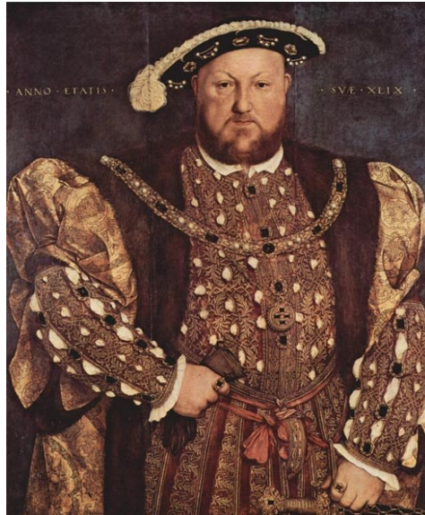
Портрет Генриха VIII. 1536 – 1537 гг.

На своих полотнах Гольбейн старался изобразить каждого человека как личность, которой присущи определённые особенности, в этом проявлялась гуманистическая направленность его творчества.