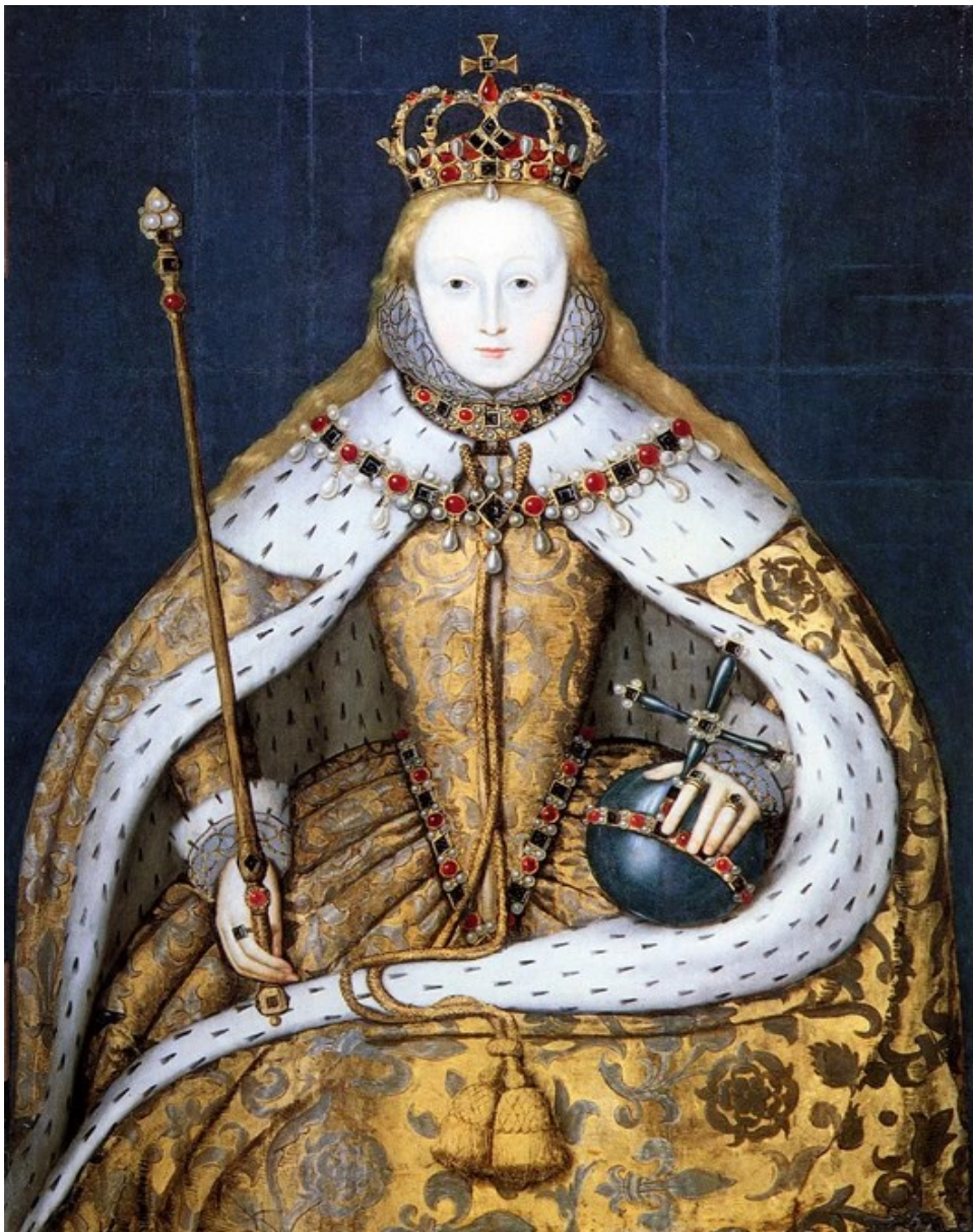
Коронационный портрет Елизаветы I

Когда лондонцы узнали о смерти Марии 17 ноября 1558 года, они от радости разожгли костры. Трон перешел к единокровной сестре Марии Елизавете I (1558 – 1603). Ее продолжительное правление стало «золотым веком» в истории Англии. Об этом свидетельствовали выигранные сражения, успехи мореплавателей, литературные шедевры. Елизавета пользовалась у подданных популярностью. Она старалась поддерживать образ сильной королевы, которая радеет за свой народ.