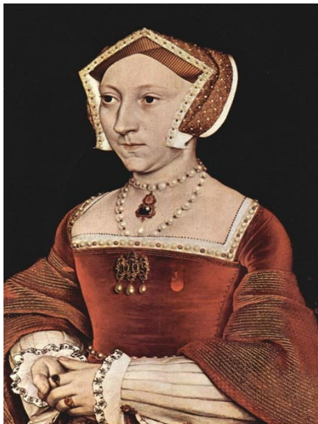
Портрет Джейн Сеймур. 1536 г.