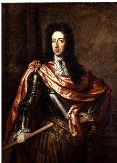
Портрет Вильгельма III (1701)

После смерти Лели придворным художником стал немец Годфри Кнеллер. У него было большое количество помощников. «Моделей зарисовывали карандашом, потом дописывали. Говорили, что Кнеллер мог принять до четырнадцати моделей за день. Многие портреты по этому были однообразны, механистичны и ничем не примечательны» 56 . Эти парадные портреты не выявляли личностных особенностей, а подчеркивали богатство и высокое положение человека в обществе. Но если портретируемый вызывал у художника интерес, то он раскрывал его индивидуальность.