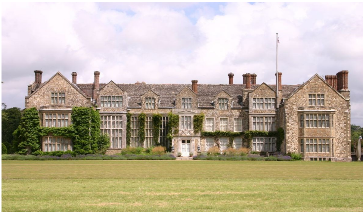
Усадьба Пархэм-хаус (Parham House)

По сравнению с XV веком в XVI столетии в Англии увеличилось количество мебели, музыкальных инструментов, одежды, лекарств. Стали строить больше домов: в Англии – из кирпича, в Шотландии – из камня. Аристократы занимались генеалогическими изысканиями, стремились получить хорошее образование, строили особняки в новом стиле, которые больше не походили на крепости, имели очень много окон и длинные галереи.