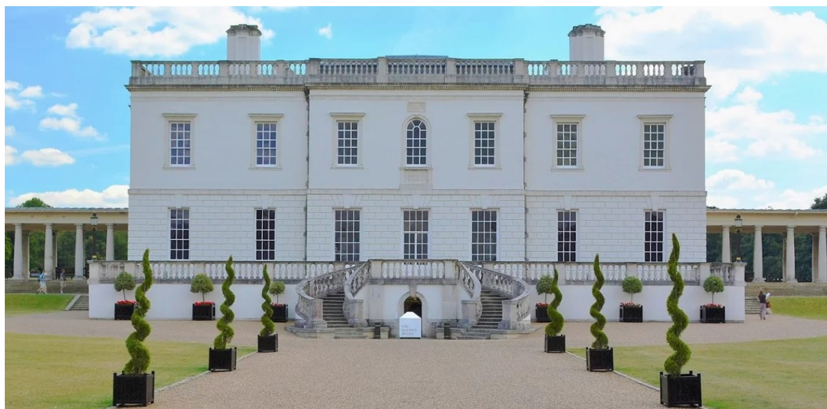
Дом королевы в Гринвиче

Одним из шедевров Иниго Джонса является Дом королевы, расположенный в Гринвиче – пригороде Лондона. Его отличают симметричный фасад, отсутствие выступов, большие окна.