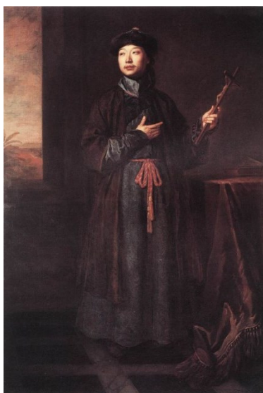
Обращённый китаец (1687)