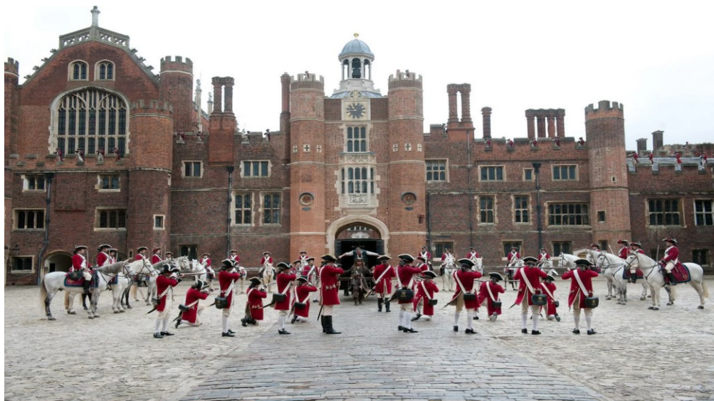
Сент-Джеймский дворец (St. James's Palace)

В архитектуре в конце XV – первой половине XVI века размер окон и дверей уменьшается, в обиход входят большие каминные и печные трубы. Нередко на крыше возводятся декоративные башенки. Во внутренний двор можно было пройти через широкую низкую так называемую тюдоровскую арку.