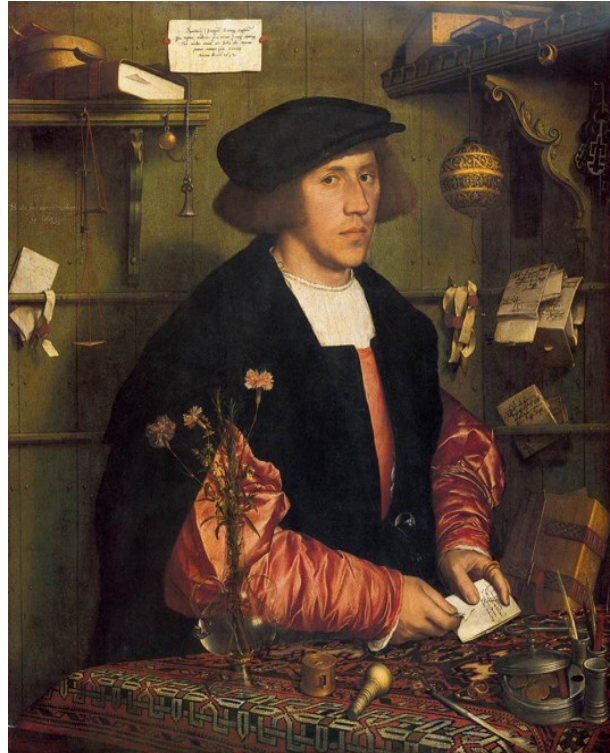
Портрет Георга Гизе. 1532 г.