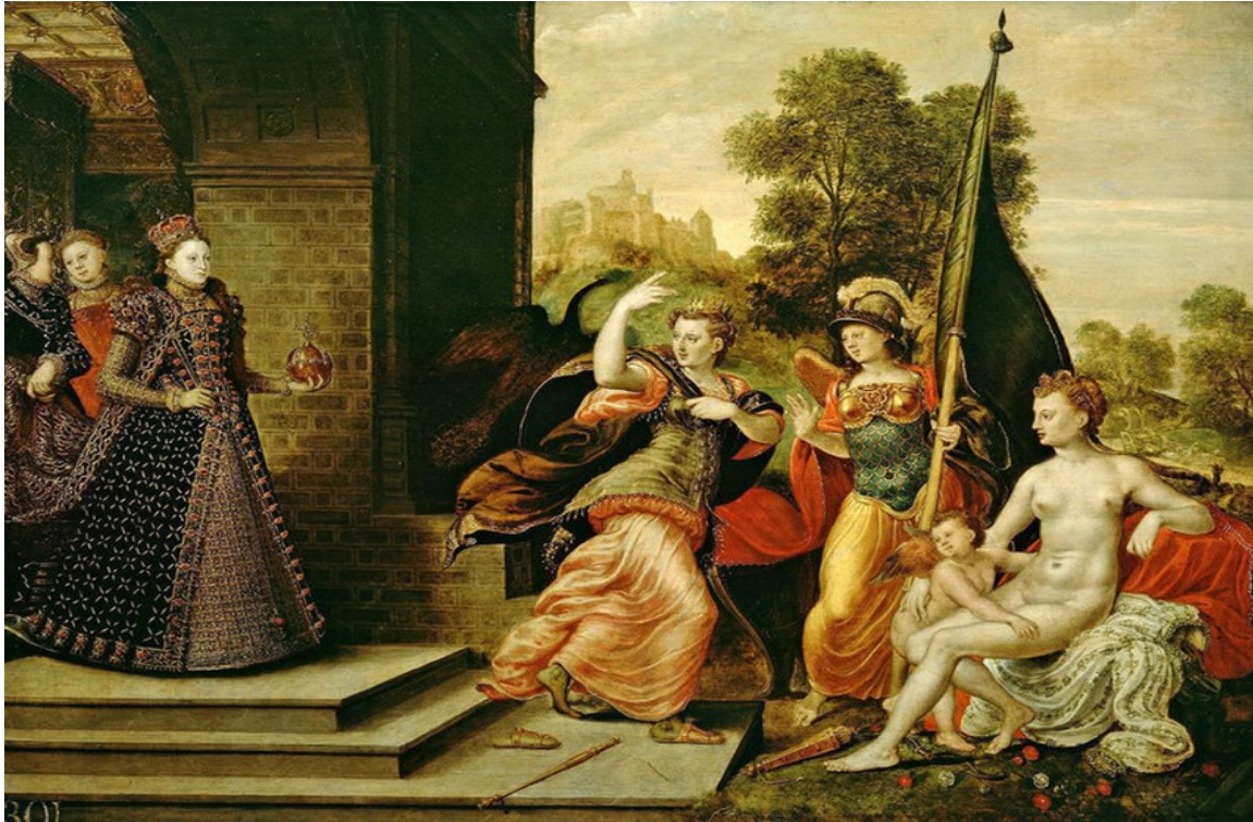
Королева Елизавета приводит в смущение Юнону, Минерву и Венеру. Портрет приписывается Гансу Эварту. 1569 г.