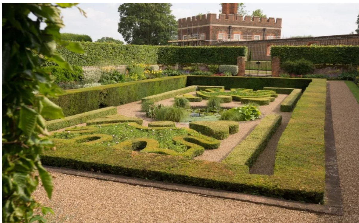
Парк Хэмптон-корт (Hampton court Park)

Рядом с усадьбами нередко размещали сады и парки с живыми изгородями.