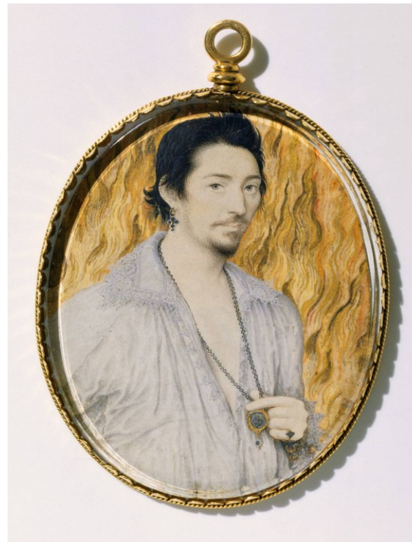
Неизвестный на фоне пламени. Портрет работы Хиллиарда. 1600 г.

Подводя итоги правления Тюдоров, следует отметить, что в этот период экономическое развитие Британии шло в позитивном ключе.