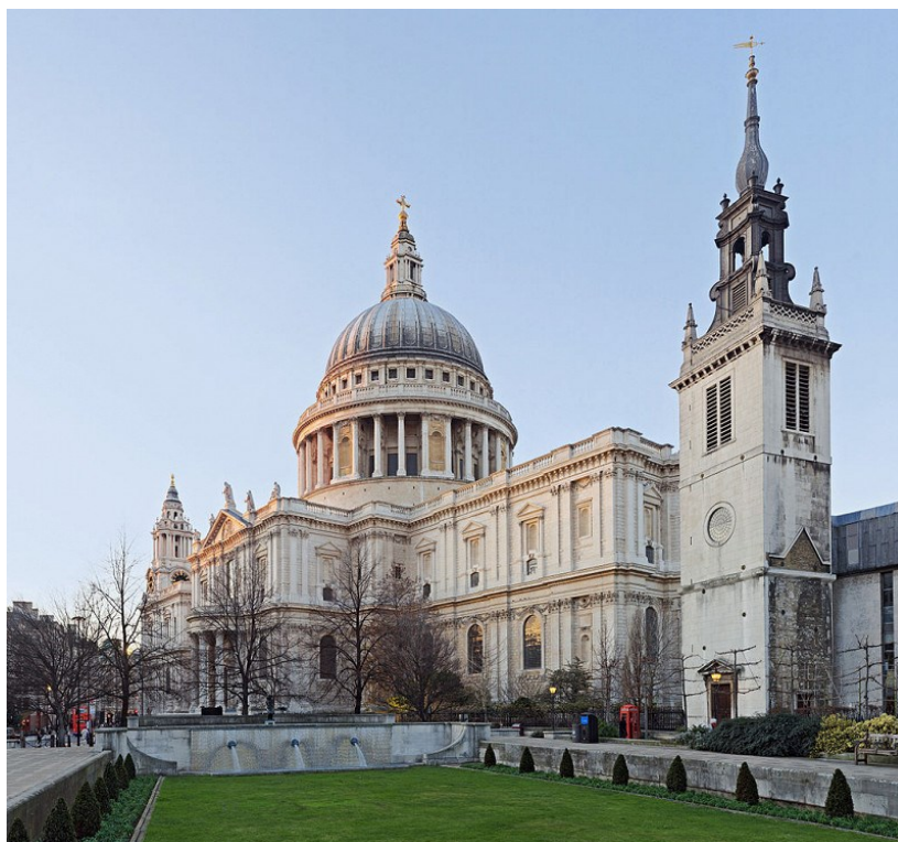
Собор Святого Павла

Самое известное сооружение Кристофера Рена – собор Святого Павла, возведенный на месте разрушенного Великим пожаром 1666 года более раннего готического храма. Его строительство производилось с 1675 по 1710 годы. Это единственный в Британии собор в стиле классицизма. В нем большое количество колонн, в том числе сдвоенных. Башня над средокрестием выполнена в форме купола, который интересен галереей шёпотов. Внутри собора создается ощущение простора и наполненности светом.