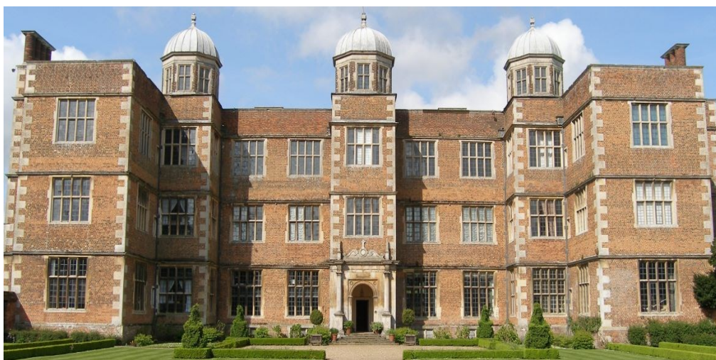
Усадьба Доддингтон-холл (Doddington Hall)

Для усадеб елизаветинского периода характерен симметричный фасад, большие прямоугольные окна, завершающиеся аркой двери с колоннами по бокам. Надвратные башни приобрели чисто декоративный характер.