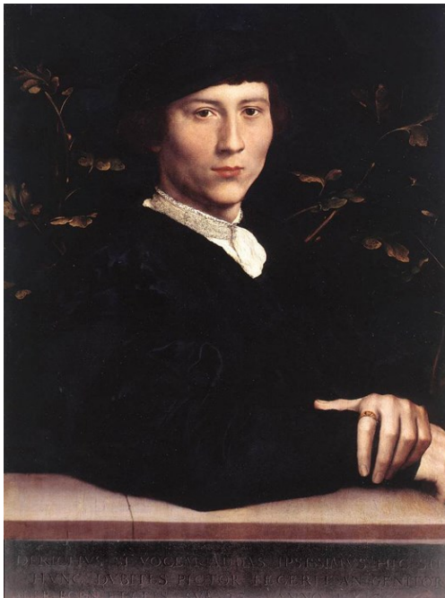
Портрет Дериха Борна. 1533 г.