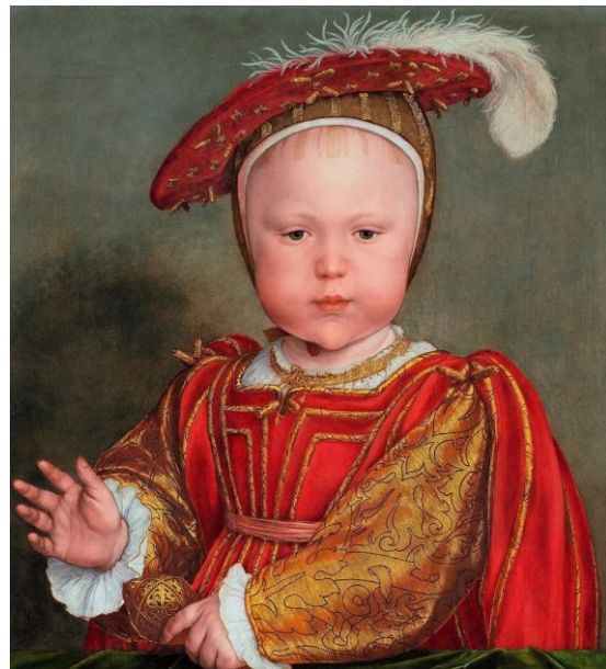
Портрет Эдуарда VI 1538 г.