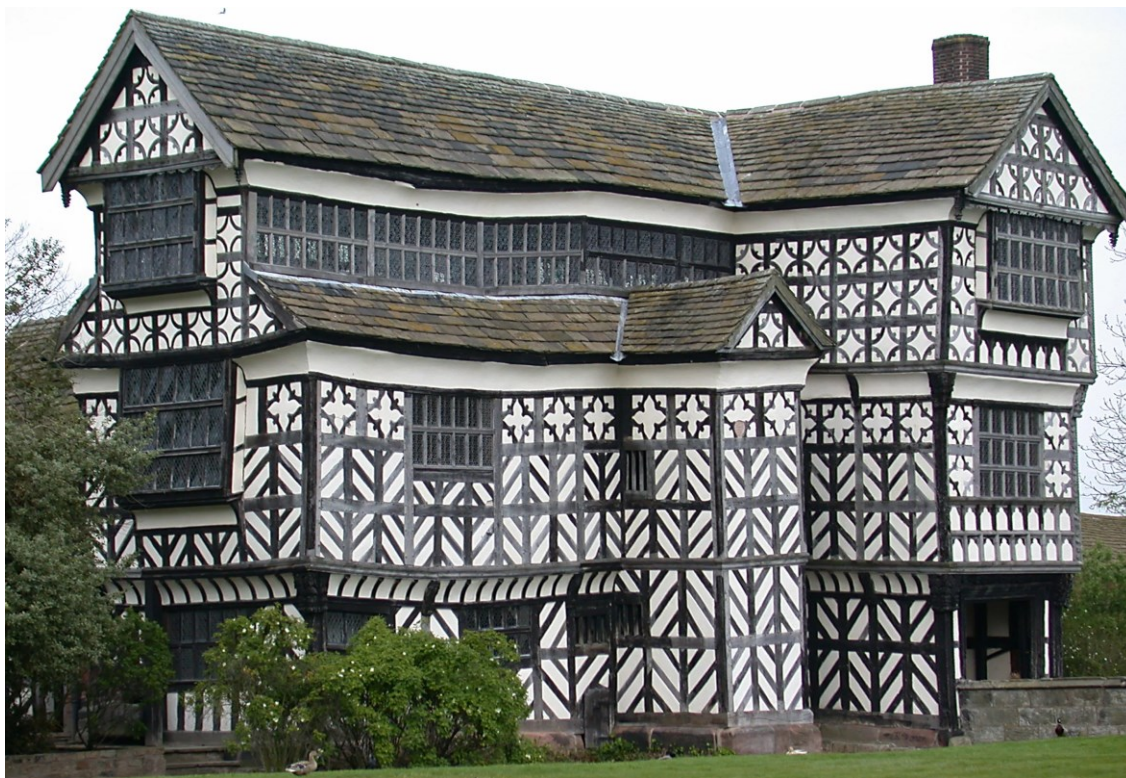
Мортон-олд-холл (Morton Old Hall)

Наглядным примером фахверкового дома может служить усадебный дом Мортон-олд-холл (Morton Old Hall), возведенный в графстве Чешир в 1559 – 1602 годах.