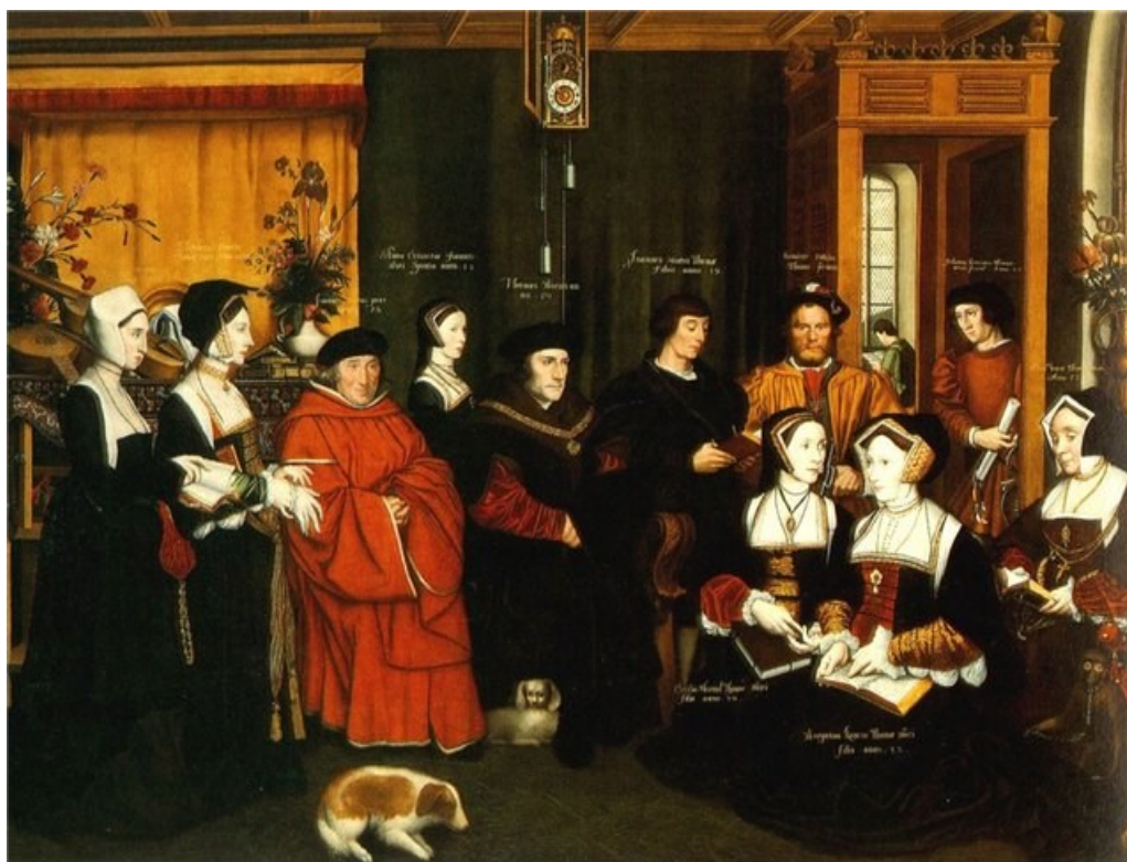
Портрет семьи Томаса Мора. 1527 г.

Придворным художником Генриха VIII был немецкий живописец Ганс Гольбейн. После роспуска монастырей – центров развития изобразительного искусства – английская художественная культура пришла в упадок, поэтому в XVI – XVII веках главную роль в изобразительном искусстве Британии играли иностранцы, излюбленным жанром которых был портрет. Ганс Гольбейн (1497 – 1543), отец и брат которого тоже были художниками, сначала трудился в Швейцарии, побывал во Франции и Италии, а в 1526 году в возрасте двадцати восьми лет переместился в Англию, где вскоре приобрел известность. Он написал портреты государственного деятеля и писателя-гуманиста Томаса Мора и его семьи, астронома Николаса Кратцера, иностранных купцов, посетивших в Лондон, – Георга Гизе и Дериха Борна. Перу Гольбейна принадлежит и портрет главного сокольничего Генриха VIII Роберта Чизмена, удивляющий игрой плоскостного и трехмерного пространства.