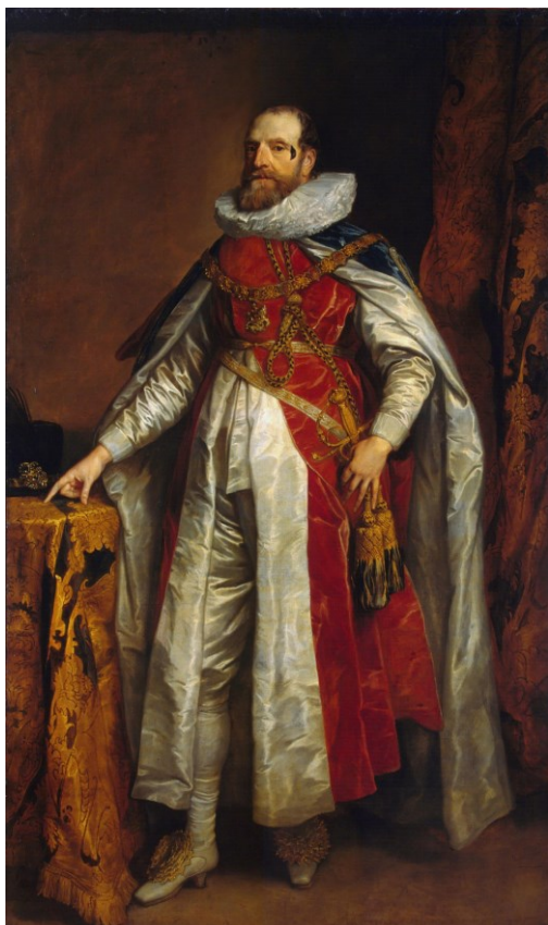
Портрет эрла Дэнби как рыцаря ордена Подвязки

Чаще всего Ван Дейк писал портреты аристократов, как парадные, так и камерные. Известны также его полотна на евангельские и исторические темы.