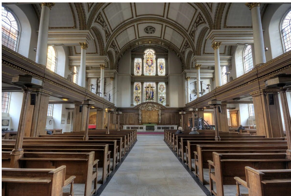
Церковь св. Иакова на Пикадилли

После Великого пожара Рен занялся постройкой приходских церквей в Лондоне. В районе Сити их было возведено пятьдесят две: церковь св. Стефана у стенного ручья, св. Марии в Боу, св. Иакова на Чесночном холме, св. Иакова на Пикадилли, аббатство св. Николая и другие. «Новый тип церкви – это здание, где как можно больше людей могут с комфортом послушать проповедь» 55 . Иногда добавлялись галереи, позволявшие увеличить вместимость церкви. Большое значение отводилось кафедре, с которой священники читали проповеди. Если готические храмы уносили человека в мир ангелов и демонов, то классицистические взывали к здравому смыслу.