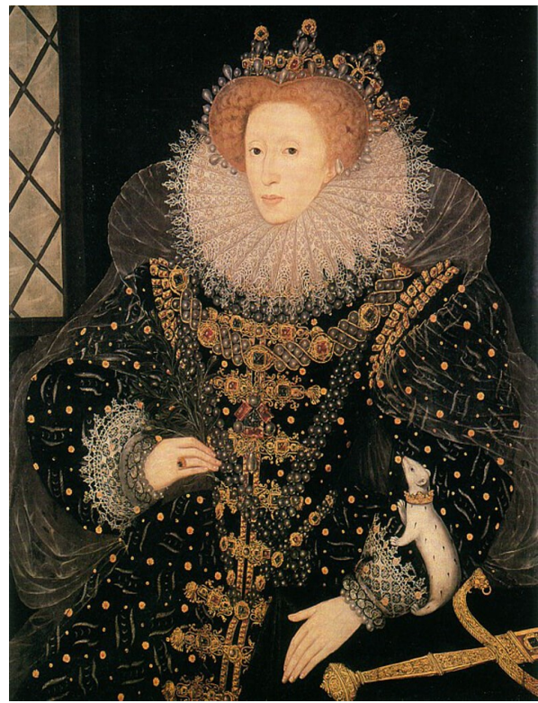
Портрет с горностаем. Работа Хиллиарда. 1585 г.