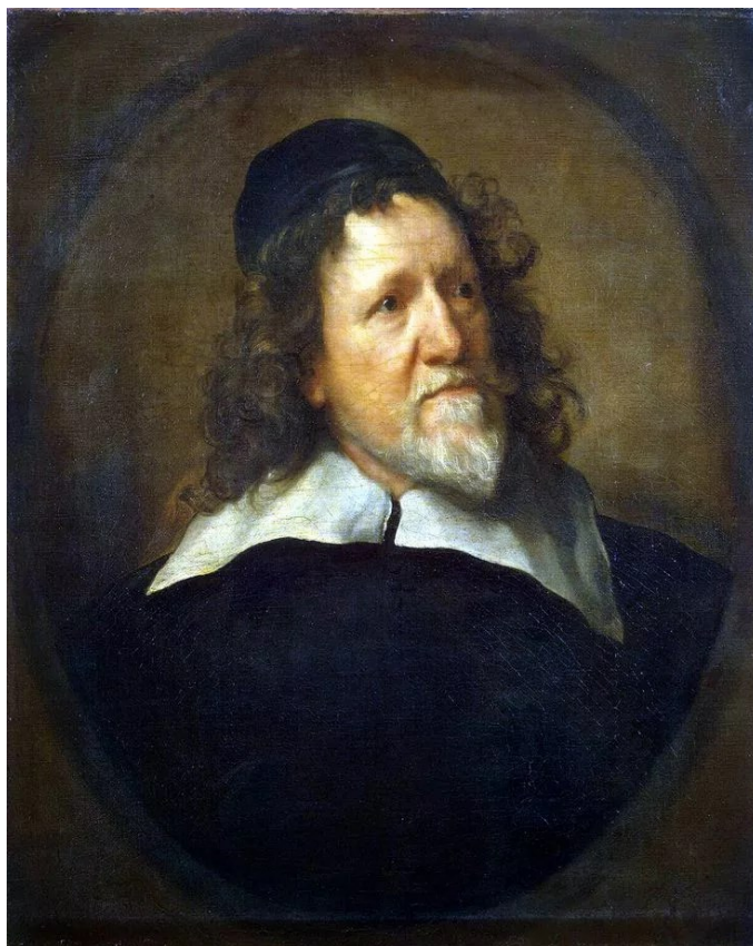
Портрет Иниго Джонса