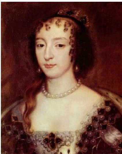
Королева Генриетта-Мария (1660)

Во второй половине XVII столетия, как и прежде, среди живописцев, творивших в Британии, преобладали иностранцы. Голландец Питер Лели, приехавший в Англию в середине века, стал придворным художником. Его кисти принадлежит множество женских портретов, в частности королевы Генриетты-Марии, актрисы и фаворитки Карла II Элинора (более известной как Нелл) Гвинн.