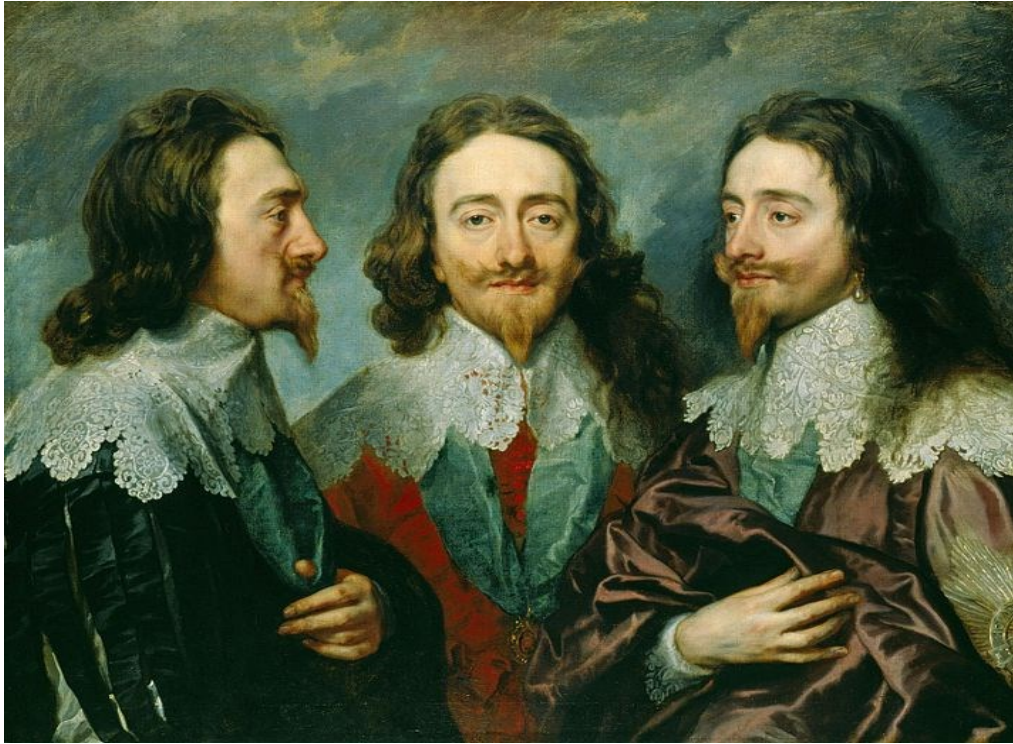
Тройной портрет Карла I (1635 – 1636)

На Большом портрете, поражающем своими размерами (3×2,5 м), Ван Дейк изобразил короля в кругу семьи: с женой и старшими детьми. Мощная колонна за его спиной дает понять, что Карл I – столп нации.