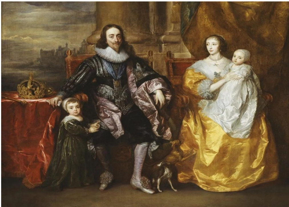
Большой портрет (1632)

На Большом портрете, поражающем своими размерами (3×2,5 м), Ван Дейк изобразил короля в кругу семьи: с женой и старшими детьми. Мощная колонна за его спиной дает понять, что Карл I – столп нации.