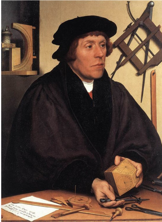
Портрет Николаса Кратцера. 1528 г.