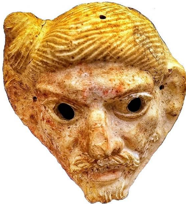
Илл. 1.12 Терракотовая маска германца. Италия, II н.э. Британский музей. Волосы мужчины уложены в «свеvский узел». Персонаж изображен с густыми усами и короткой бородой.