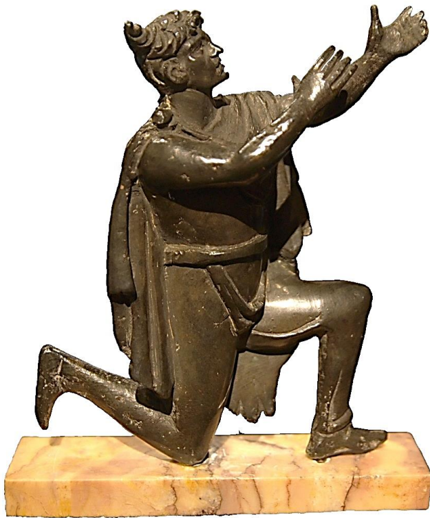
Илл. 1.11 Фигура германца. Бронза. I-II н.э. Национальная библиотека Франции. Мужчина одет в короткий плащ, застегнутый пряжкой. Его волосы уложены в «свеvский узел».